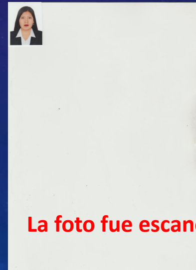
La foto fue escaneada con todo y hoja