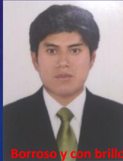
Borroso y con brillo en parte superior