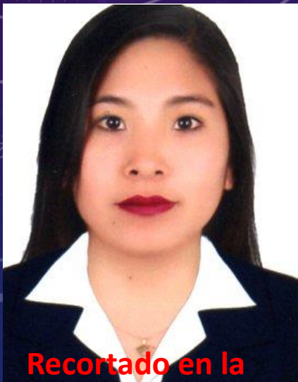
Recortado en la parte superior