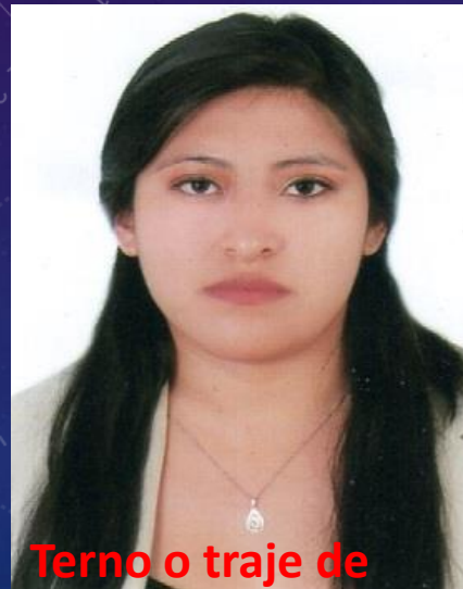
Terno o traje de color blanco o claro